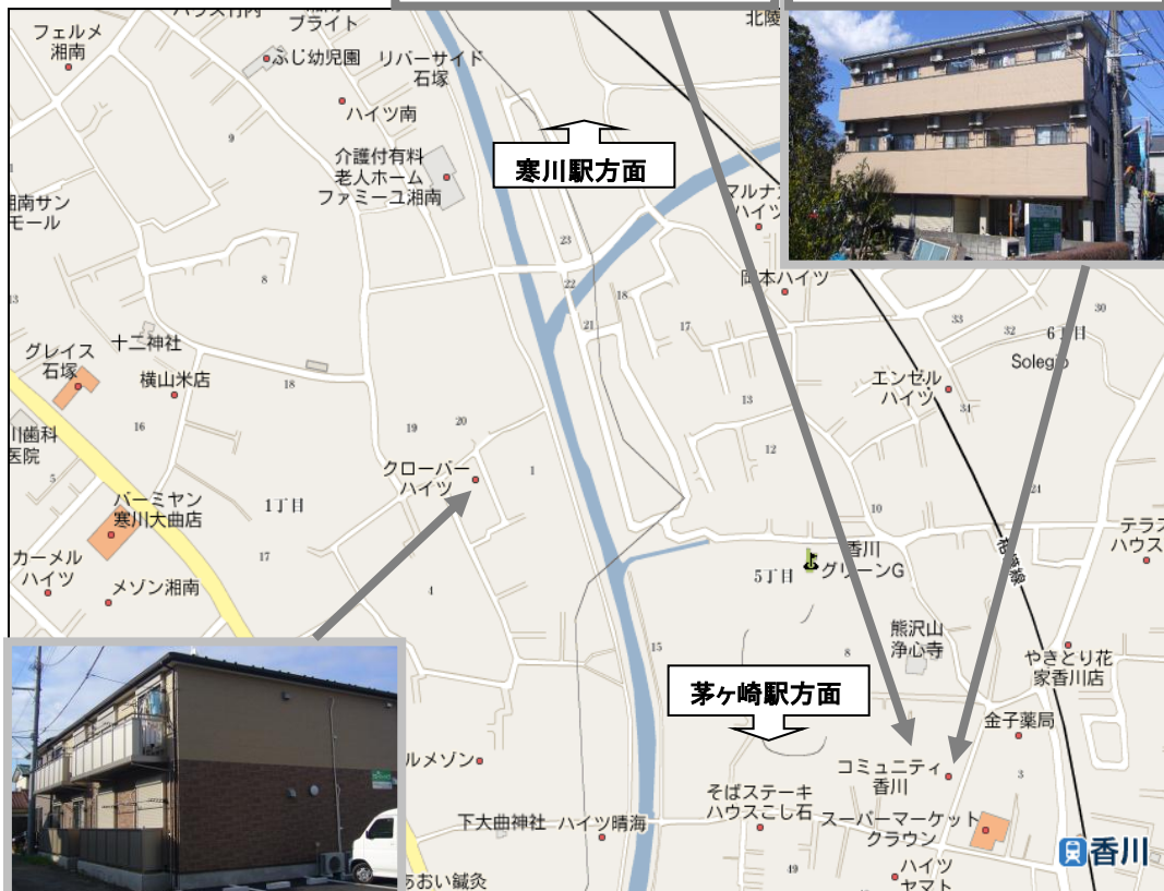
下宿屋コミュニティー香川