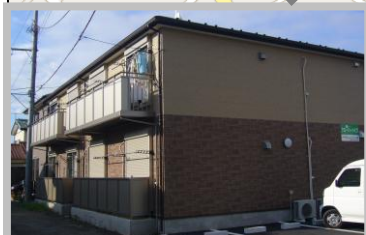
下宿屋寒川クローバーハイツ