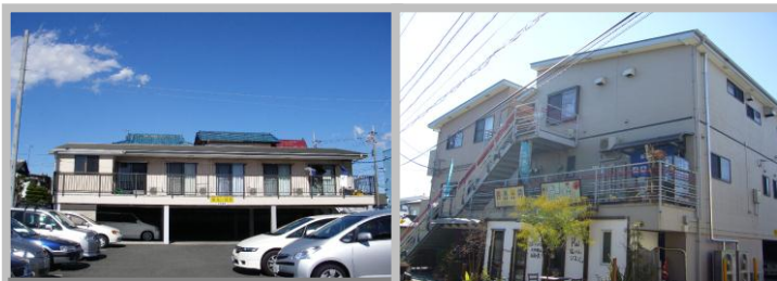
下宿屋ワンルーム